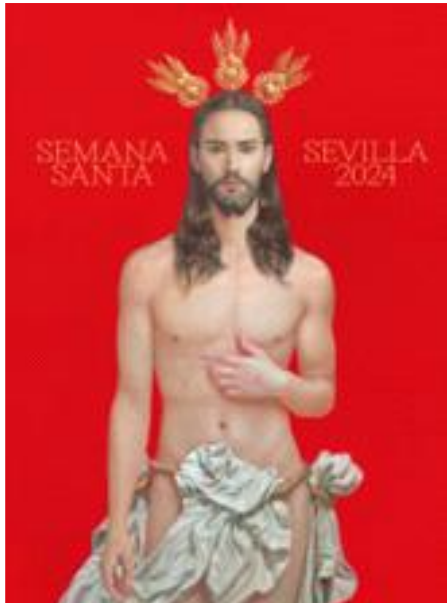
Semana Santa, Sevilla 2024 door Salustiano García Cruz