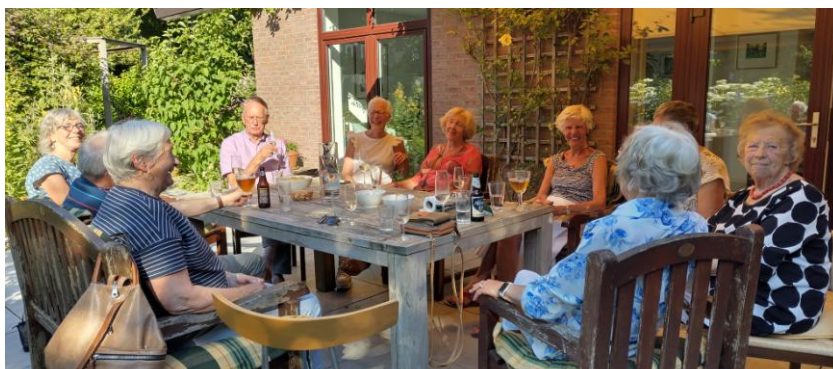
De afsluiting van het seizoen met een heerlijk en gezellig diner.

Een aantal van deze mensen, nu dus grootouders van jonge kleinkinderen, is nog steeds lid van deze gespreksgroep. De andere leden wonen elders in Maastricht, maar de meesten nog steeds in het oostelijk deel van onze stad. We zijn allemaal lid van de P.G.M.H. en voelen ons op verschillende manieren verbonden met de St. Jan.